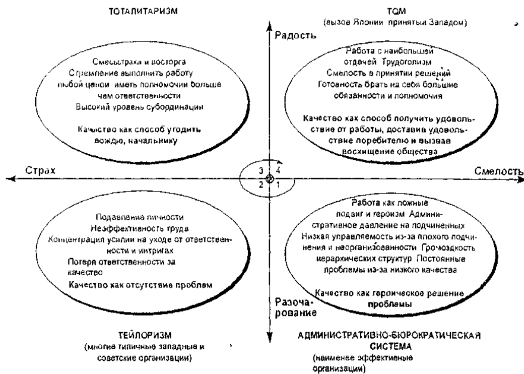
Четыре формации, по разному использующие шкалы "смелость-страх", "радость-разочарование" для мотивации Рисунок Билла Луса

Задание 2. Приведите примеры на каждый принцип Анри Файоля 14 Принципов управления Анри Файоля (1949)